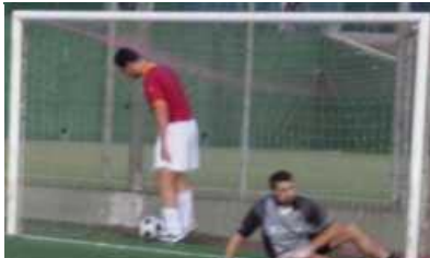
Tatanka finalmente trova pallone e porta, la sua.

Ma il consiglio di amministrazione dei SuperDigitali formato dal Conte e dal Banana respinge le dimissioni e proclama nuova fiducia al glorioso Mister in campo "El Salsero", raggiunto all'aeroporto dalla decisione ci pensa per circa 2 ore, contattata Scaccomatto e poi torna sui suoi passi, il peggio è passato.